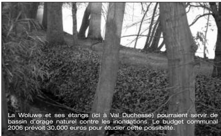
La Woluwe et ses étangs (ici à Val Duchesse) pourraient servir de bassin d'orage naturel contre les inondations. Le budget communal 2006 prévoit 30.000 euros pour étudier cette possibilité.