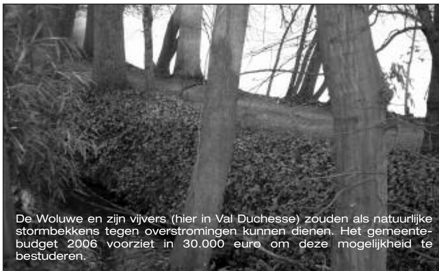
De Woluwe en zijn vijvers (hier in Val Duchesse) zouden als natuurlijke stormbekkens tegen overstromingen kunnen dienen. Het gemeentebudget 2006 voorziet in 30.000 euro om deze mogelijkheid te bestuderen.